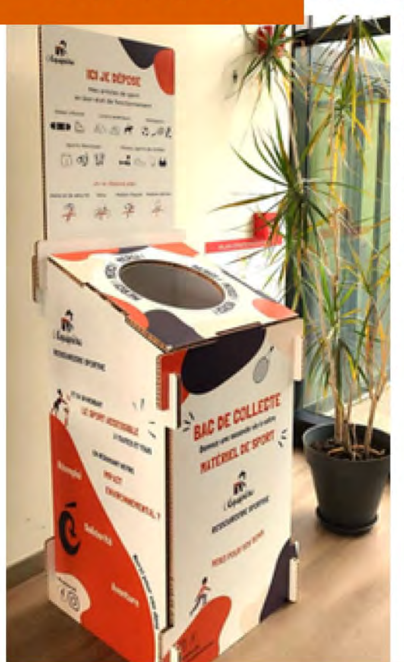
Tri & valorisation

En route vers le sport pour toutes et tous