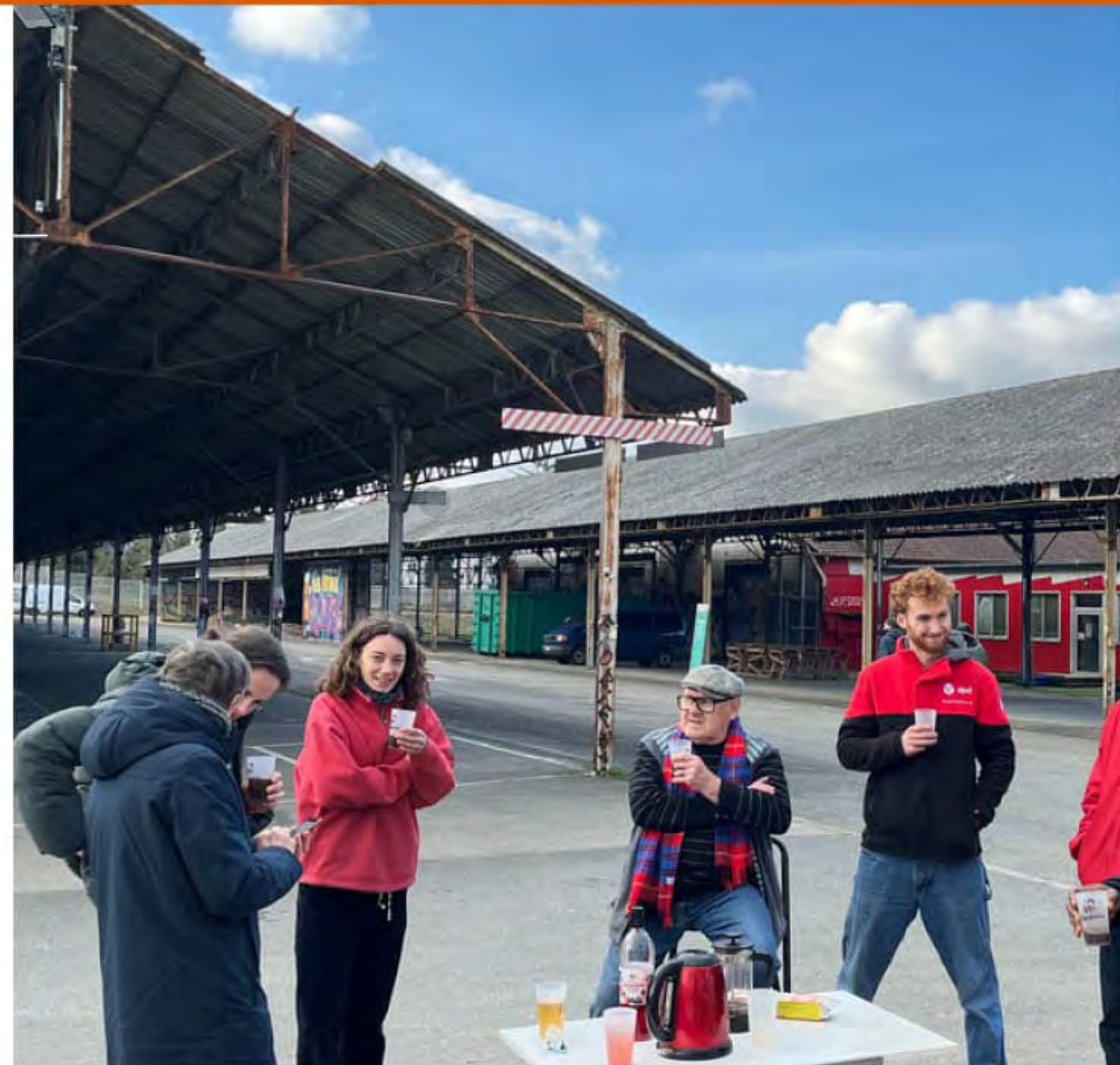
Vie de quartier