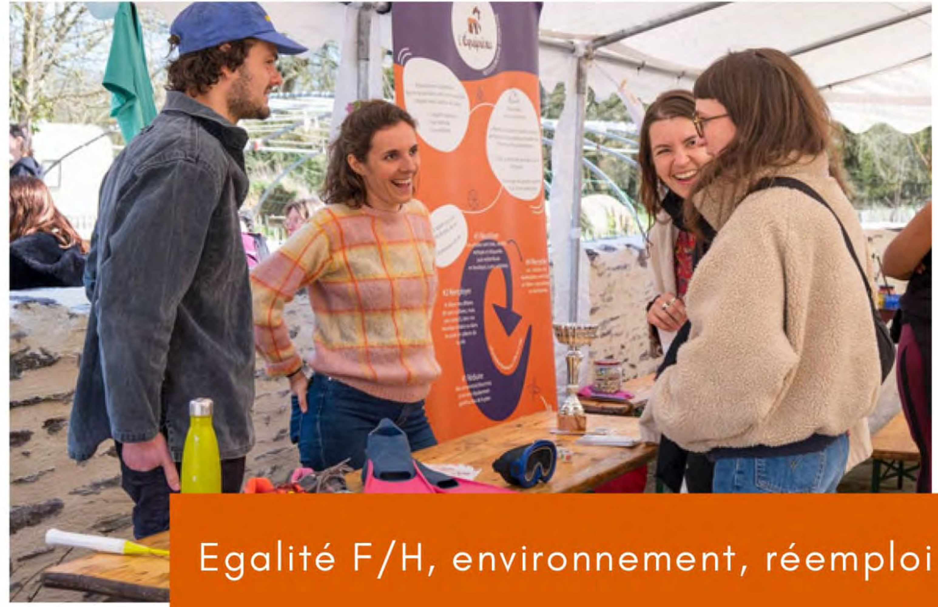
Egalité F/H, environnement, réemploi

Les valeurs du sport et du collectif pour sensibiliser au développement durable auprès d'étudiant.es et d'entreprises